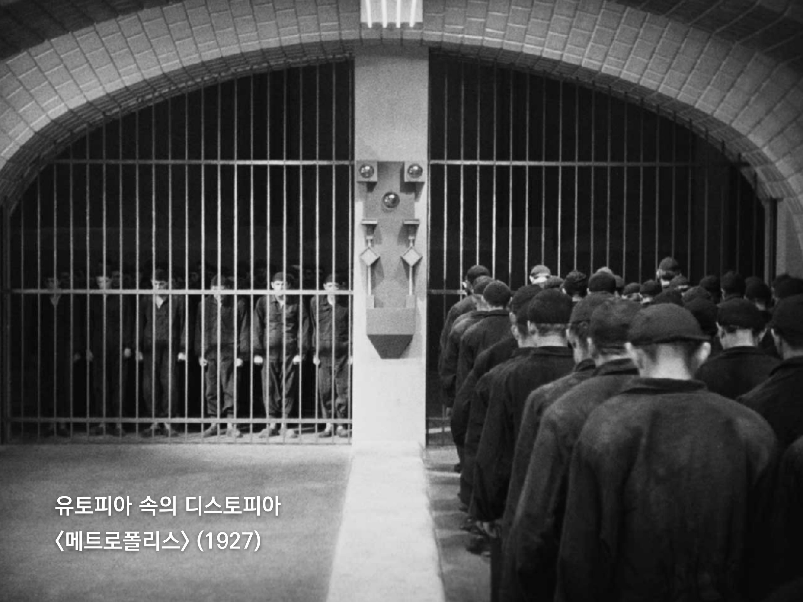
유토피아 속의 디스토피아 《메트로폴리스》 (1927)